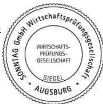
Dr. Burkhardt-Böck Wirtschaftsprüferin

Eine Verwendung des Bestätigungsvermerks außerhalb dieses Prüfungsberichts bedarf unserer vorherigen Zustimmung. Bei Veröffentlichungen oder Wiedergabe des Jahresabschlusses und/oder Lageberichts, der Dierig Holding AG, Augsburg, in einer von der bestätigten Fassung abweichenden Form (einschließlich der Übersetzung in andere Sprachen) bedarf es zuvor unserer erneuten Stellungnahme, sofern hierbei unser Bestätigungsvermerk zitiert oder auf unsere Prüfung hingewiesen wird; auf § 328 HGB wird verwiesen. Bei der Printversion des Prüfungsberichts handelt es sich um eine Kopie des digitalen Originals.